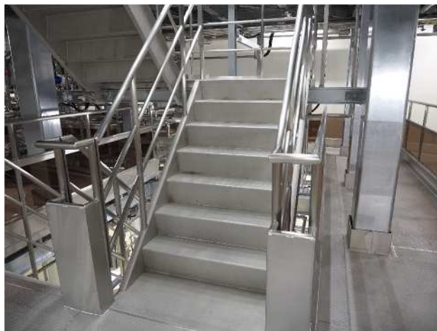
同工場内：ポリカプレートが使用されている階段