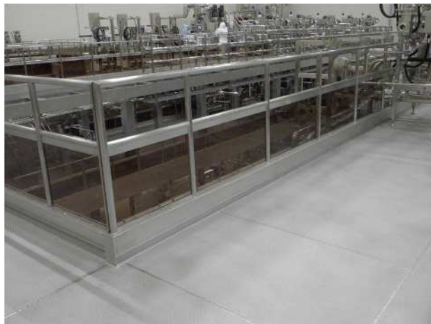
同工場内：ポリカプレートが使用されているステージ