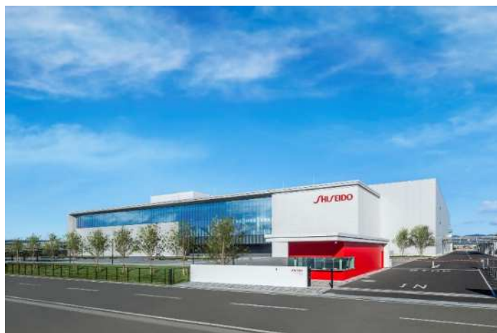
資生堂 福岡久留米工場 外観

ボルカプレートは、化粧品・食品・薬品・日用品などのさまざまな分野の工場において、床・階段・ステージ等の建材として採用されてきました。当社は今後も幅広い分野でのソリューション営業を通してお客様のニーズにお応えし、安全・環境配慮型の製品を世の中に提供してまいります。