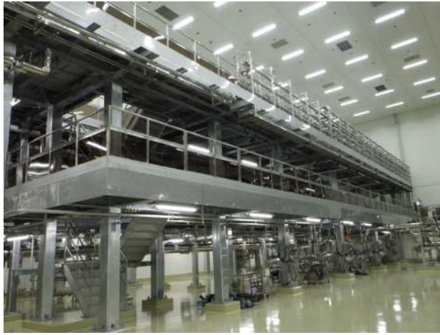
福岡久留米工場内